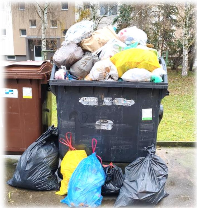
Třídění odpadu v obci Libočany

Každý kalendářní rok je všem obcím představen na setkání s Marius Pedersen a EKO KOM stav třídění jednotlivých komodit, jako je papír, sklo, plasty, kovy, nápojové kartony a směsný komunální odpad. Naše obec si nevede vůbec špatně, ba naopak, jsme dobří. Všem, kdo třídí, děkujeme! Máme však zpětnou vazbu k tomu, že některé nádoby jsou u nás přeplněné a netřídí se dostatečně. Chtěli bychom Vás požádat, aby nádoby na komunální odpad před vývozem měly uzavřené víko, jelikož co je nad víko, bude obec platit navíc nebo nebude vyvezeno. Navýšení poplatku se pak bude týkat všech občanů, děkujeme.