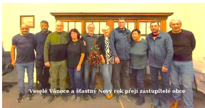
Veselé Vánoce a šťastný Nový rok přeji zastupitelé obce