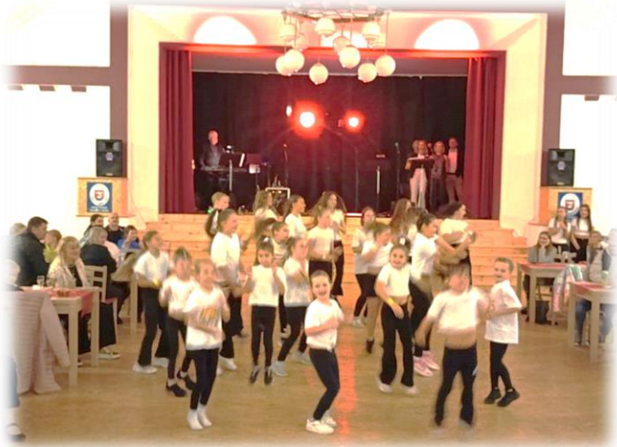
Taneční škola Stage Dance Žatec na setkání seniorů