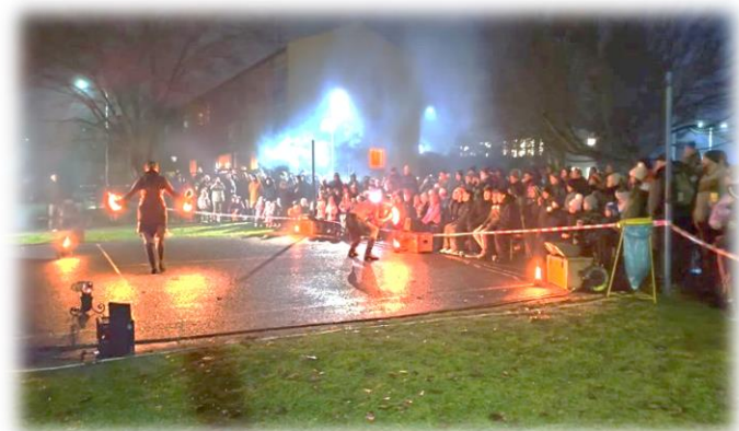
Rozsvěcení Vánočního stromu v Libočanech