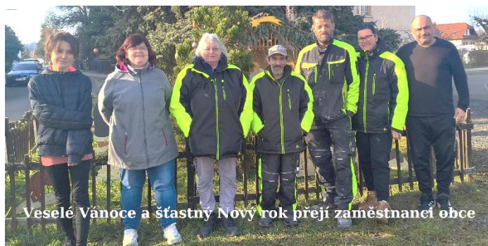
Veselé Vánoce a šťastný Nový rok přeji zaměstnanci obce