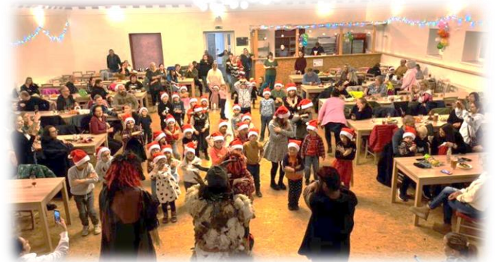
Mikulášská nadílka v KD Libočany