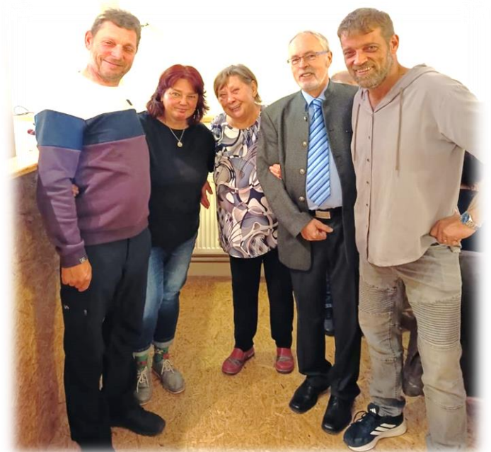
Zastupitelé na akci „Setkání seniorů a rodáků obce“