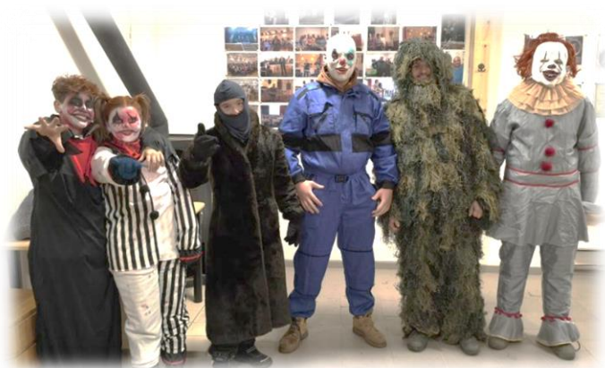
Stezka odvahy v Libočanech