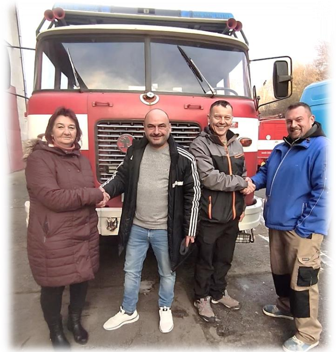
Předání Škoda 706 RTH, CAS 25 do výpůjčky Žiželicím